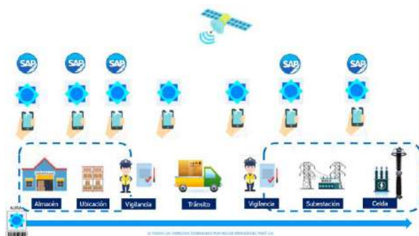
Fig. 3. AURA en el ciclo de vida

El aplicativo generará desde de la solicitud de requerimiento un código único para los activos-componentes que se están adquiriendo, desde este momento el sistema estará en la capacidad de recibir información vital del activo por parte del proveedor. Esta información podrá ser validada y corregida mediante una plataforma de fácil manejo.