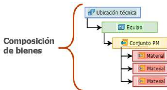
Fig. 2. Bill of materials. ERP SAP

Al buscar la gestión integral del activo, se concluye que para ejercer trazabilidad sobre los activos se requiere establecer control Logístico de los mismos, pero en este punto vemos que el control no solo se requiere aplicar sobre los activos sino también sobre los componentes de los activos, pues durante el ciclo de vida del activo, existirán necesidades de reemplazo de partes del activo y necesitamos gestionarlas de manera óptima. Esta forma de gestión a distintos niveles es necesaria y vital para la gestión del mantenimiento. Para enlazar estos conceptos se estructura al activo bajo la forma activo-componente empleando Bill of Materials, permitiendo una conexión ágil con los almacenes y las existencias de los mismos. El código único también está estructurado para soportar este concepto.